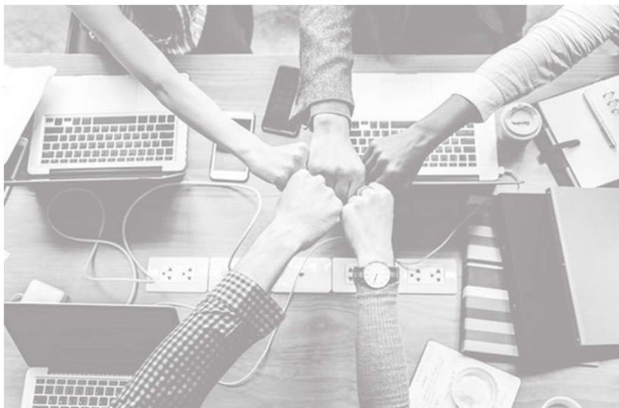
Slika 4: Nastava

Nastava se odvija u dvoranama, učionicama i kabinetima opremljenima potrebnom opremom za sve studentske smjerove. Prostor Visokog učilišta prilagođen je pristupu za osobe s invaliditetom. Dvorane i predavaonice označene su imenima velikih hrvatskih i svjetskih inovatora i pionira tehnološkog napretka (Nikola Tesla, Ruđer Bošković, Faust Vrančić, Eduard Slavoljub Penkala, Steve Jobs, Ivan Picelj, Galileo Galilei, Marie Curie, Ada Lovelace, Ivan Vučetić). Za sve informacije, upise, predavanje molbi, rješavanje statusa studija te ostala studentska pitanja na raspolaganju Vam je Studentska referada, smještena pokraj jednog od ulaza u zgradu. Visoko učilište Algebra raspolaže internom knjižnicom („Book Point“) s više od tisuću naslova iz područja računarstva, multimedije, marketinga i dizajna. raspolaganju knjižnica s čitaonicom na drugom katu zgrade.