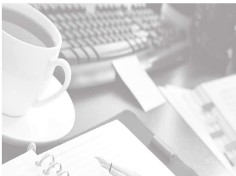
Slika 2: Ispiti 1

Prvi međuispiti očekuju vas nakon osmog tjedna nastave i raspoređeni su kroz dva tjedna. Oni pokrivaju skupove ishoda učenja obrađene kroz tih osam tjedana nastave. Drugi međuispiti bit će organizirani nakon završetka semestra i to je zapravo početak zimskog i ljetnog ispitnog roka. Na drugom međuispitu ćete prvo pisati zadatke koji se odnose na skupove ishoda učenja obrađene u drugoj polovici semestra (nakon prvog međuispita), a nakon toga možete ispravljati sve ranije skupove ishoda.